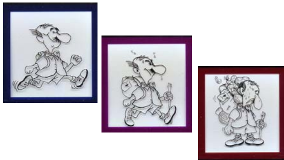
Abbildung 3: „... im Laufe unseres Lebens wird unser Rucksack immer voller ...“

Burnout-Erkrankungen sind also die Folge von chronischen Belastungen, die sich im Laufe des Lebens eines Menschen ansammeln und nach und nach die Energie eines Menschen aufzehren. Was müssen Sie tun, um Burnout-Erkrankungen zu vermeiden oder aus dem Burnout-Zustand wieder herauszukommen? Eigentlich ist die Antwort ganz einfach: